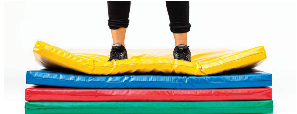
COLCHÓN PARA DEPORTE/INFANTIL