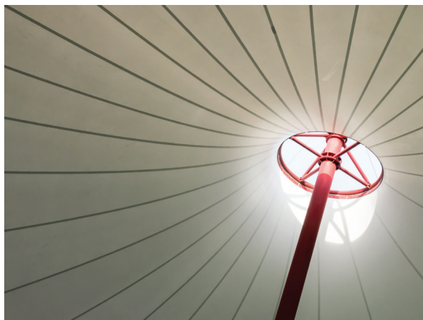
TECHO DE LONA