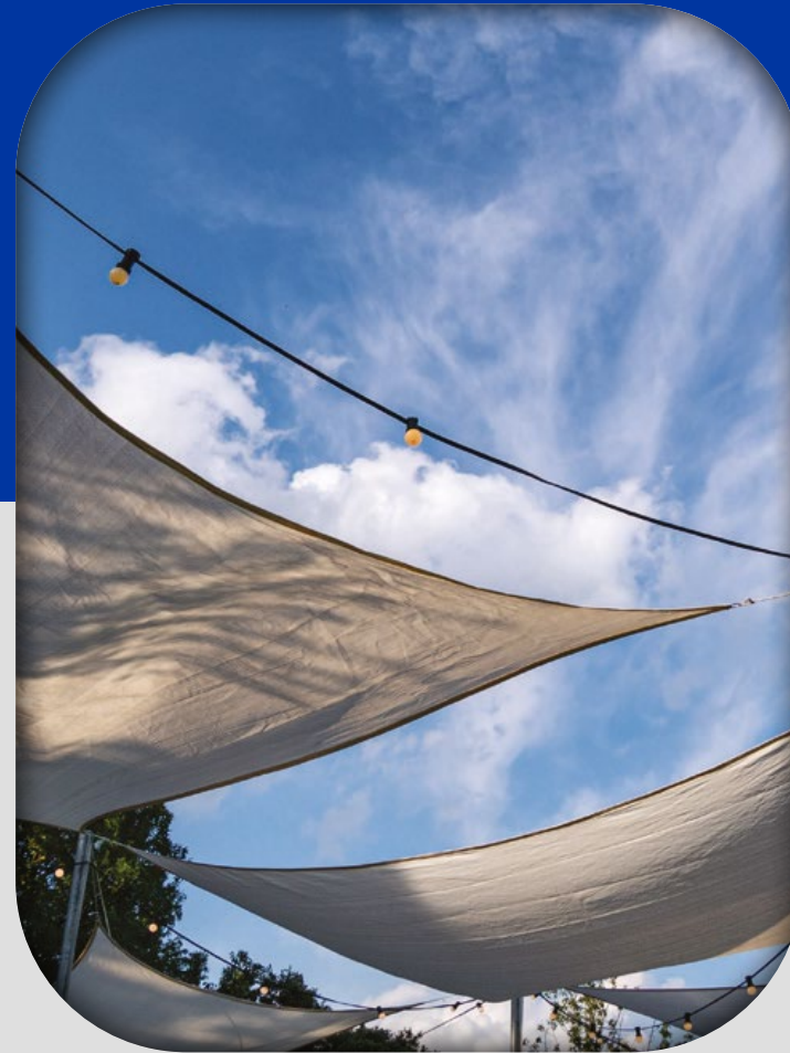
Carpas y Toldos