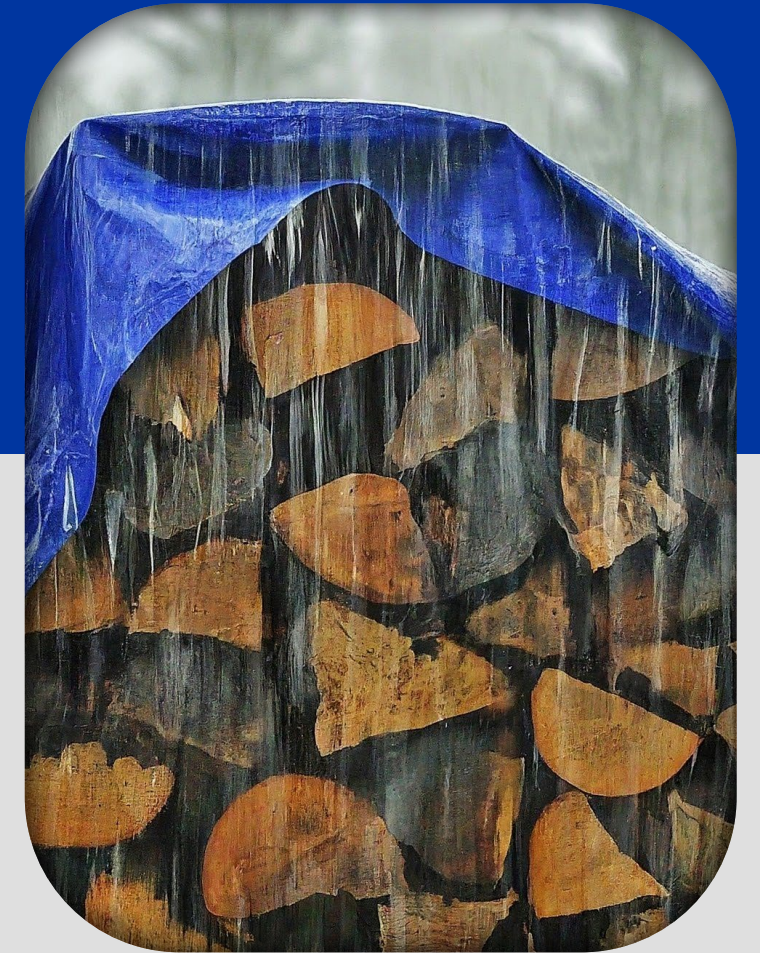
Protección contra la Intemperie