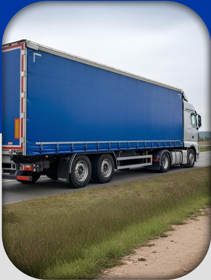
Remolques y Transportación