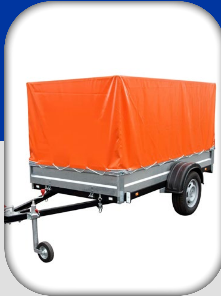
Remolques y Transportación