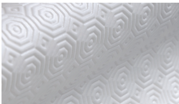
SUTSA GRIP BLANCO 120