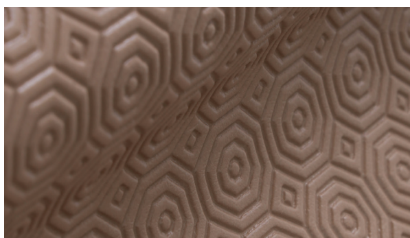
SUTSA GRIP BEIGE 646