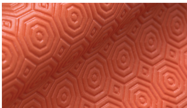
SUTSA GRIP NARANJA 331