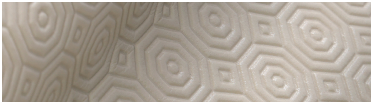
SUTSA GRIP HUESO 248